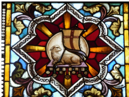
MARÍA, REINA DE LA PAZ

“16 Tengo, además, otras ovejas que no son de este corral y a las que debo también conducir: ellas oirán mi voz, y así habrá un solo Rebaño y un solo Pastor”. (Jn 10, 16)